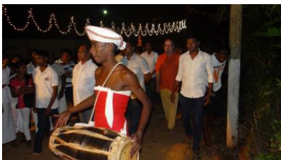
Warten vor der Eröffnung

Vor 2 Wochen wurde in unserem Zentrum das Wesak - Fest (Vollmond-Fest ) gefeiert. Tagelang wurde es durch die Bewohner von Baddegama vorbereitet, Spenden gesammelt, aufgeräumt und gekocht. Dann kamen die Gäste. Wir hatten ca. 3000 Besucher zum Abendessen und da es nur 150 Sitzgelegenheiten gab, bildete sich natürlich eine lange Schlange bis zur Straße. Die Aktion war ein großes Erlebnis und für uns insofern ein Erfolg, als wir jetzt noch stärker in die Umgebung integriert sind.